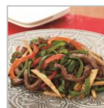
チンジャオロース