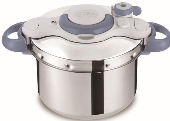
サックスブルー (4.5L・6L)