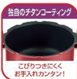
こびりつきにくく お手入れカンタン!