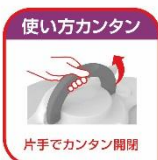
片手でカンタン開閉