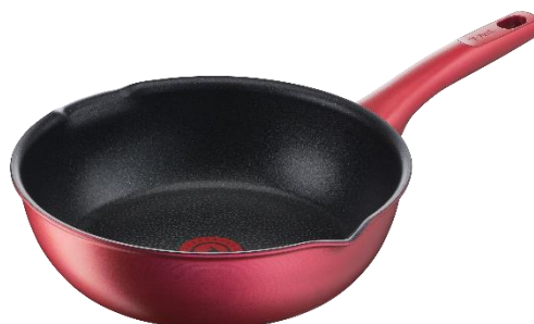
IH ルビー・エクセレンス マルチパン 26 cm