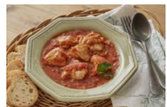
(無水) トマトデミチケン