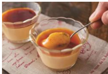
カスタードプリン