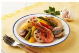
(無水) 魚介のガーリック風