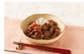
(無水) 牛すじこんにゃく煮