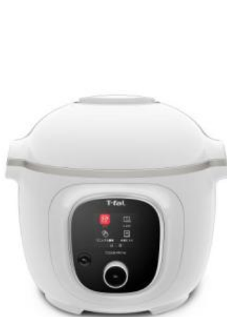
クックフォーミー 6L

5月30日にリニューアルした「ティファールアプリ」は、いつでもレシピを簡単に検索できるので、外出先で献立づくりや買い物に便利にお使いいただけます。内蔵レシピだけでなく、季節のイベントに合わせたレシピも満載です。「クックフォーミー」は、たっぷり作れてデザインも新しくなった6Lサイズと、2～4人家族にぴったりな3Lサイズの2種類からお選びいただけます。