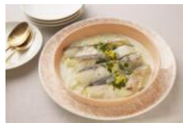
(無水) 白身魚のクリーム煮