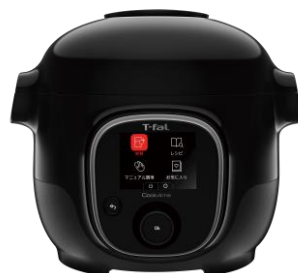
クックフォーミー 3L