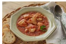
(無水) トマトデミチキン