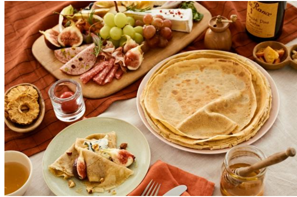
パーティボードクレープ