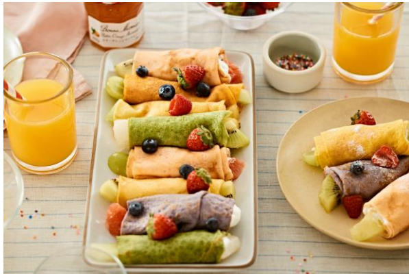
レインボークレープ