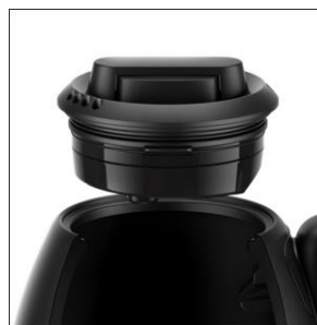
【倒れてもフタが外れにくい設計】