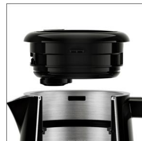
【倒れてもお湯がこぼれにくい、フタの設計】