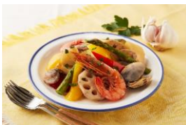
(無水) 魚介のガーリック風

● 食材に含まれる水分と最低限の調味料で素材の旨みを引き出す無水調理。素材本来のうまみと栄養を逃さずいただくことができます。