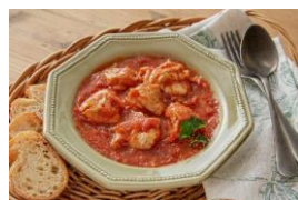
(無水) トマトデミチキン