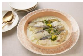
(無水) 白身魚のクリーム煮