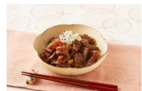
(無水) 牛すじこんにゃく煮