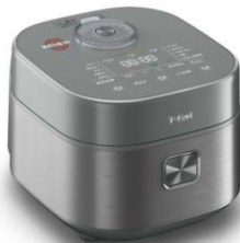
※写真はメタリックです。