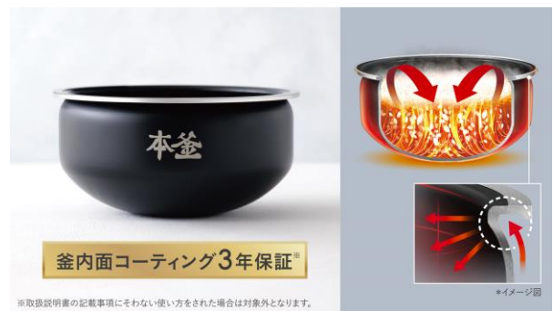
釜内面コーティング3年保証*