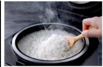
※炊き上がりイメージ