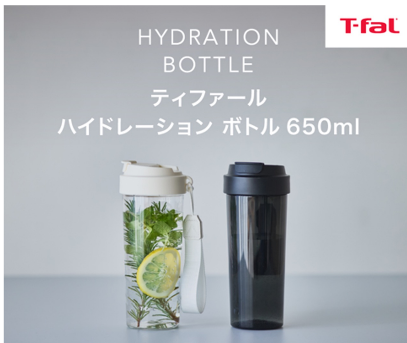
左からホワイト、ブラック